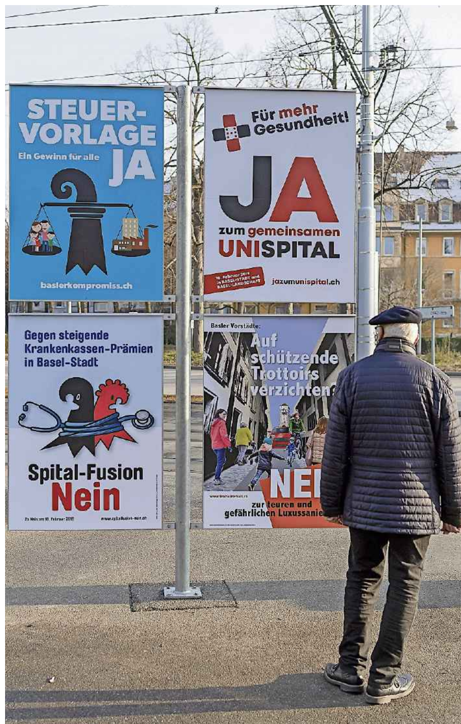
Das Grossprojekt Spitalfusion kostete bereits in der Planung viel Geld.