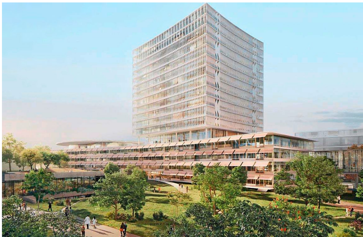
So soll dereinst das neue Gebäude vom Architektenteam Herzog & de Meuron/Rapp aussehen. Visualisierung: Herzog & de Meuron/Rapp

Es ist das dritte Spital, das die Architekten Herzog & de Meuron bauen werden. «Wir wollen ein Spital mit einer menschlicheren,