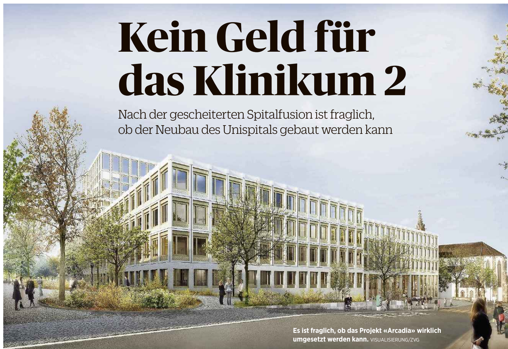
Es ist fraglich, ob das Projekt «Arcadia» wirklich umgesetzt werden kann. VISUALISIERUNG/ZVG

Die zweite Möglichkeit besteht darin, die Baserates, also die Basispreise für stationäre Eingriffe, zu erhöhen. Angesichts der ohnehin schon hohen Baserates am Unispital dürfte dies bei den Krankenkassen auf Widerspruch stossen. Gesundheitsökonom Willy Oggier bezeichnet die