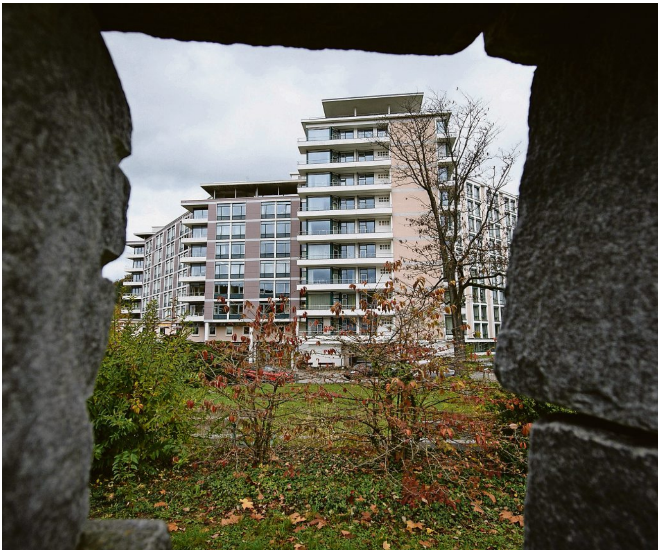
Ein düsteres Bild: das Kantonsspital in Liestal.

Das Kantonsspital soll die Standorte Liestal und Bruderholz also behalten und Laufen auf ein ambulantes Gesundheitszentrum reduzieren. Der Vorschlag der Ärzteverbände, jetzt einen Neubau auf grüner Wiese zu bauen und die maroden Spitäler aus den 60er- und 70er-Jahren zu schliessen, findet keinen Anklang, er wird gar als Träumerei diskreditiert. Ein solches Projekt sei zu diesem Zeitpunkt völlig unrealistisch, sagten am Donnerstag Regierung und Verwaltungsrat. Mit der jetzigen Strategie hingegen würde nach einer defizitären Anfangsphase ab 2025 pro Jahr ein bescheidener Gewinn von rund zehn Millionen Franken erwirtschaftet. Dadurch soll ein Handlungsspielraum geschaffen werden, der es der