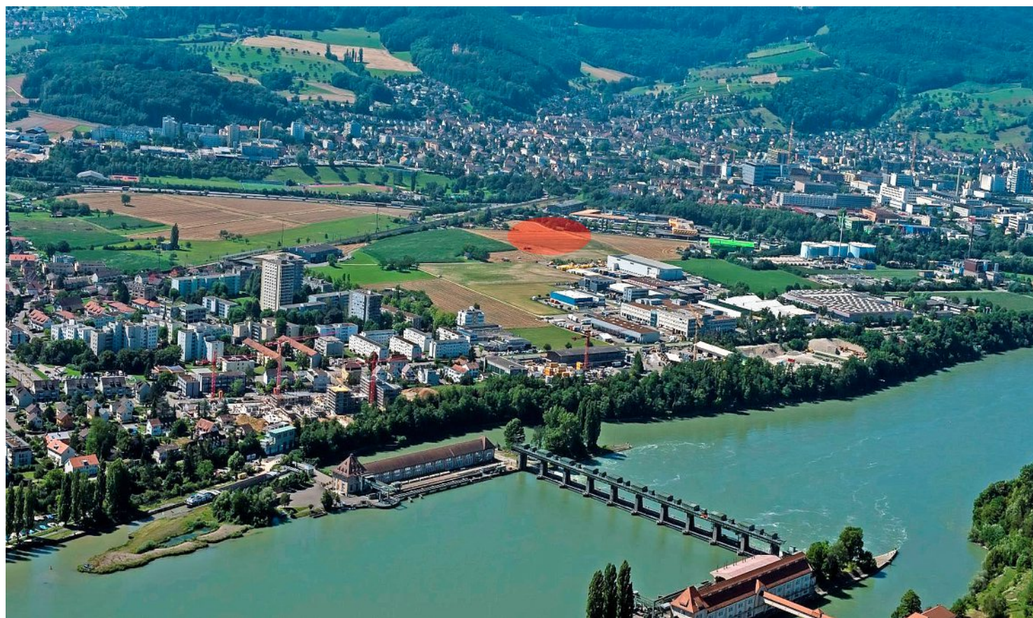
Blick auf den geplanten Standort (rot) und auf Salina Raurica, zwischen den Wohngebieten von Augst (links) und Pratteln gelegen.

Nach dem negativen Volksentscheid zu einer Spitalfusion stehe man vor dem Problem, dass die Spitäler der beiden Kantone wieder auseinanderdriften und sich als Konkurrenten verstehen. Ausserdem befinde sich das Kantonsspital an den drei Standorten Liestal, Bruderholz und Laufen in einer Situation, in der es laufend an Substanz und Finanzmitteln verliere.