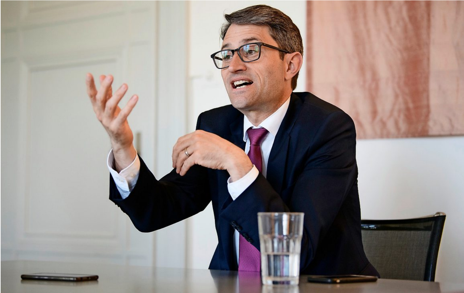
«Die Menschen haben nicht die Illusion, dass ein Gesundheitsdirektor die komplexen Herausforderungen zack, zack löst.»

Und darin liegt doch das Problem. In einem Spital mit Chefarztsystem ist der Anreiz, den Patienten womöglich unnötig